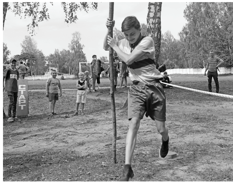
Думиничане с интересом участвовали в конкурсах «Ворошиловский стрелок», игровых и спортивных программах.